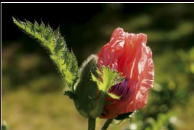
Rastliny a stromy/Plants