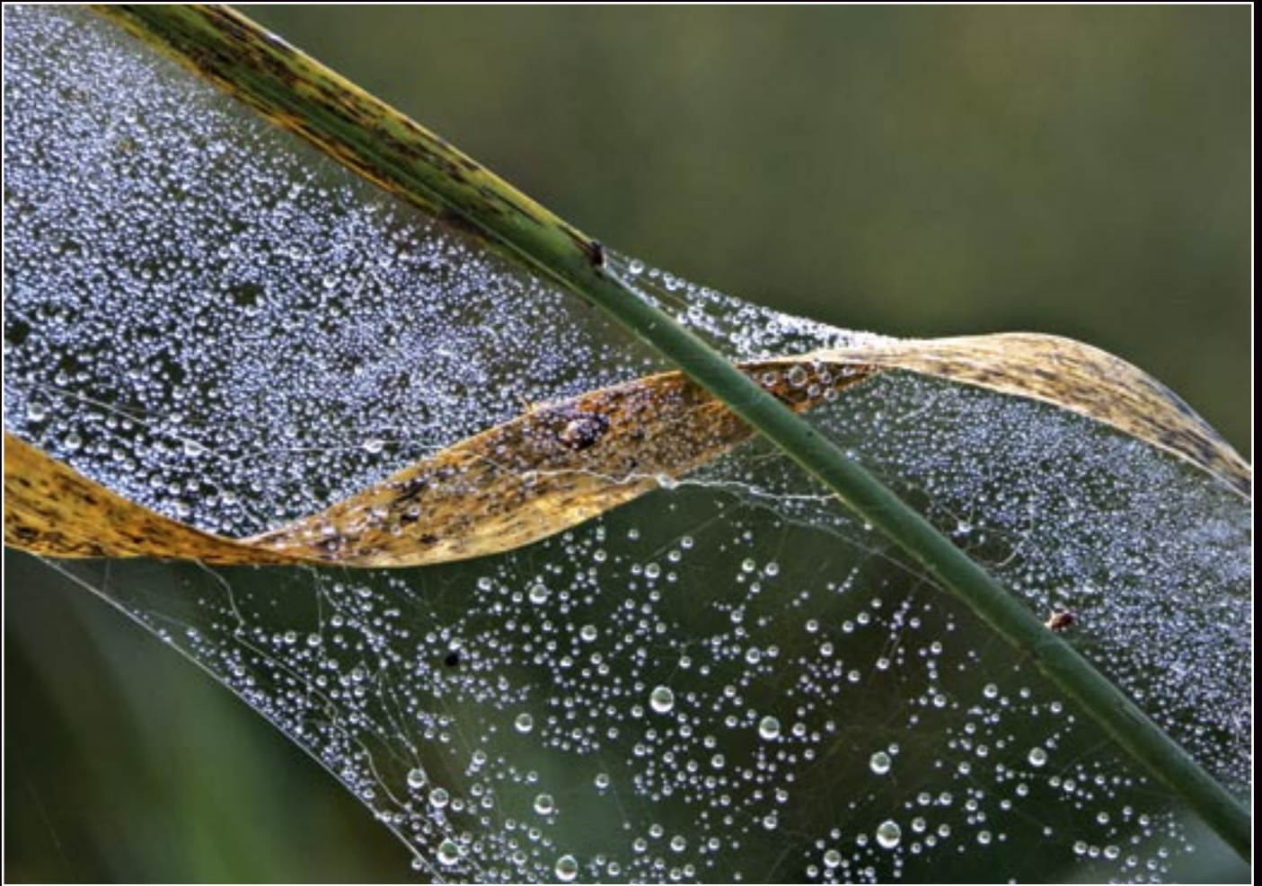
Kompozícia a forma/Composition & Form