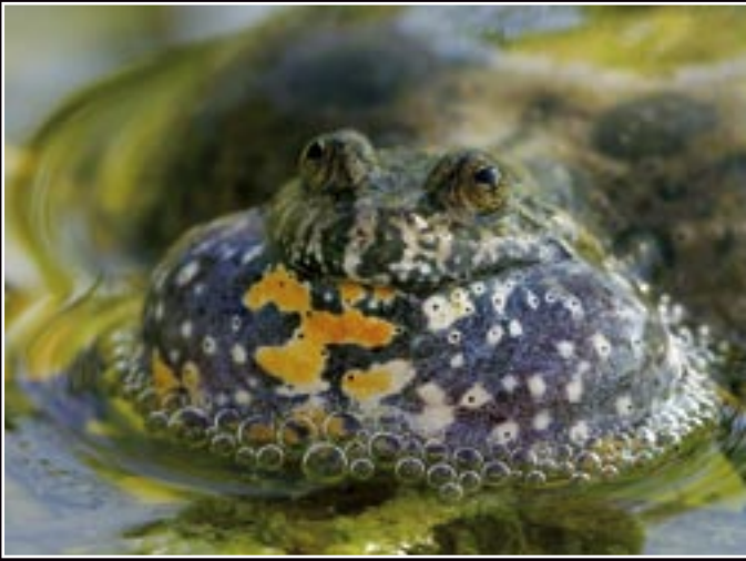
Ostatné živočíchy/Other animals