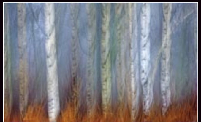
Kompozícia a forma/Composition & Form