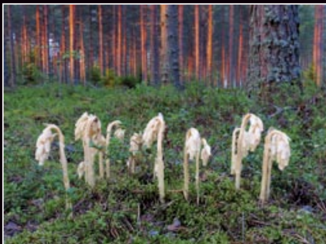
Rastliny a stromy/Plants