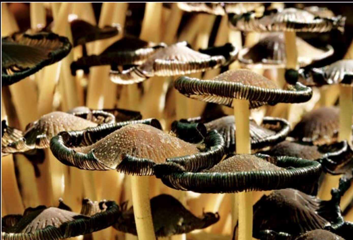
Rastliny a stromy/Plants