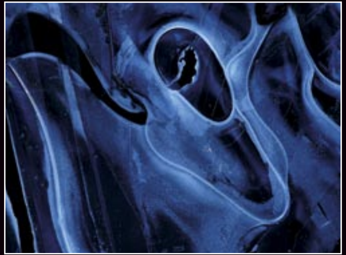
Kompozícia a forma/Composition & Form