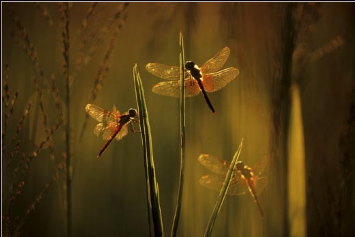
Ostatné živočíchy/Other animals